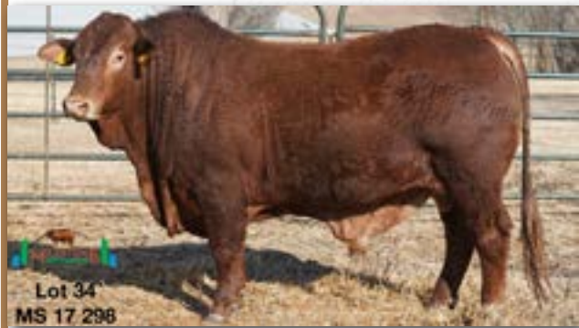
Lot 34 MS 17 298

MILESTONE MS 170298 - B 0085986933 - 06-OCT-17