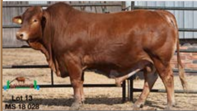
Lot 13 MS 18 028

MILESTONE MS 180028 - B 0086863008 - 07-APR-18