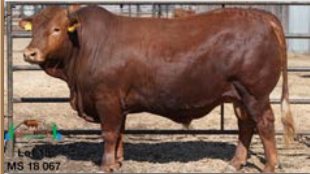
MS 18 067

MILESTONE MS 180067 - B 0087392726 - 25-JUL-18