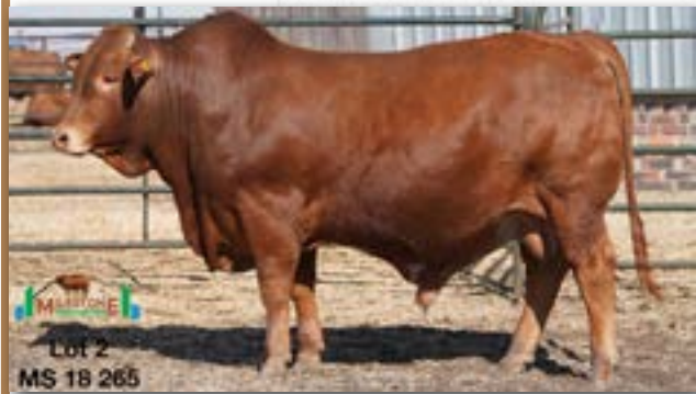
Lot 2 MS 18 265

MILESTONE MS 180265 - B 0087755948 - 17-OCT-18