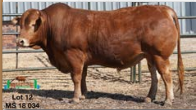
Lot 12 MS 18 034

MILESTONE MS 180034 - B 0087102729 - 16-APR-18