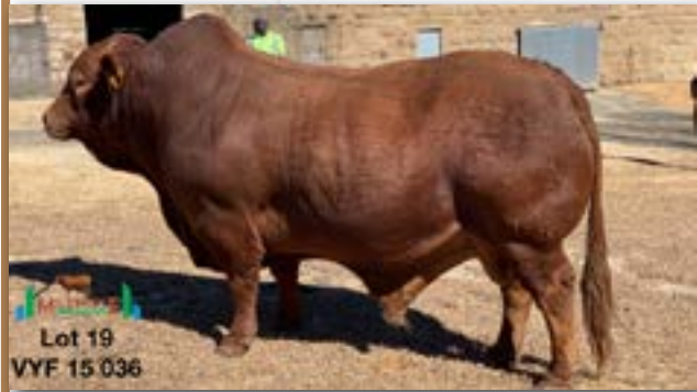
Lot 19 VYF 15 036

0604547, MYLPAAL BOERDERY, H/A MILESTONE BEEFMASTERS, POSBUS 43, MORGENZON, 2315, (T)083-441 5506