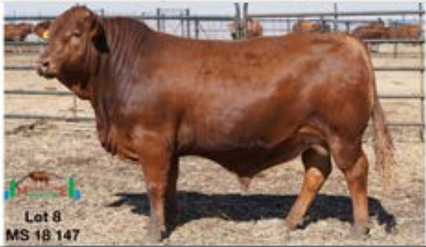
Lot 8 MS 18 147