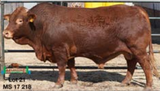
Lot 21 MS 17 218

MILESTONE MS 170218 - C 0085825966 - 21-SEP-17