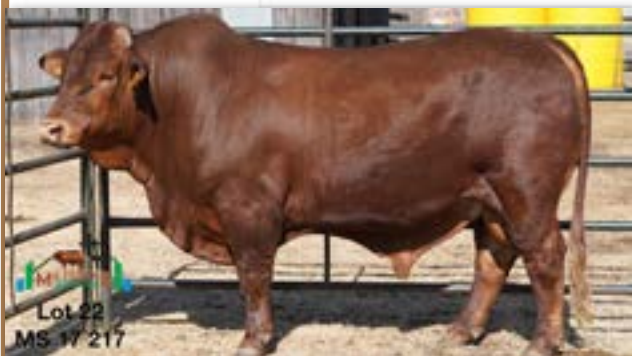
Lot 22 MS 17 217

MILESTONE MS 170217 - B 0085825941 - 21-SEP-17