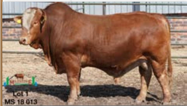
Lot 1 MS 18 013

MILESTONE MS 180013 - C 0086662927 - 26-MAR-18