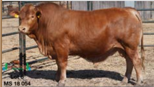
Lot 6 MS 18 054

MILESTONE MS 180054 - B 0087160578 - 21-MAY-18