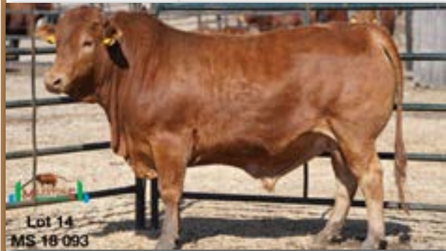
Lot 14 MS-18-093

NOOITVERWAG FRJ 940002 - B 0032194904 - 09-JUL-94