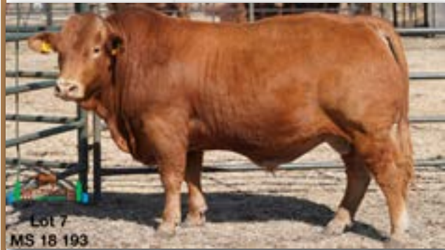
Lot 7 MS 18 193

MILESTONE MS 150183 - C 0082437203 - 27-SEP-15