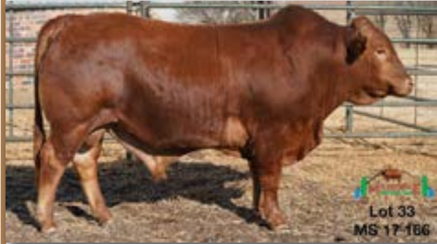
Lot 33 MS 17-166

4 X 4 FXF 020188 - B 0048991673 - 15-OCT-02