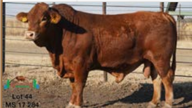
Lot 44 MS 17 284

MILESTONE MS 170284 - B 0085986842 - 02-OCT-17