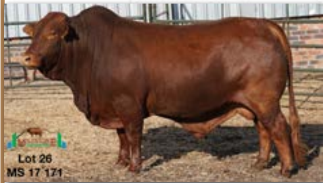
Lot 26 MS 17 171

MILESTONE MS 170171 - C 0085800183 - 10-SEP-17