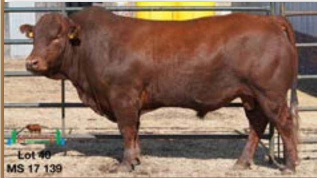
Lot 40 MS 17 139