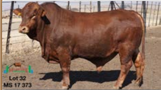
Lot 32 MS 17 373

MILESTONE MS 170373 - B 0086051646 - 31-OCT-17