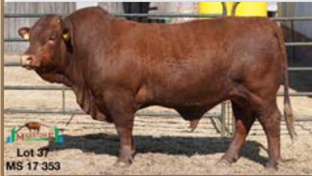
Lot 37 MS 17 353

MILESTONE MS 170353 - C 0085987410 - 18-OCT-17