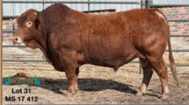
Lot 31 MS 17 412

MILESTONE MS 170412 - B 0086278447 - 30-NOV-17