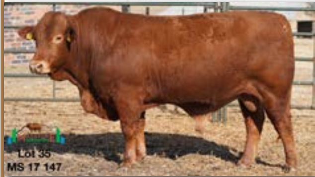
Lot 35 MS 17 147

MILESTONE MS 170147 - B 0085800035 - 05-SEP-17