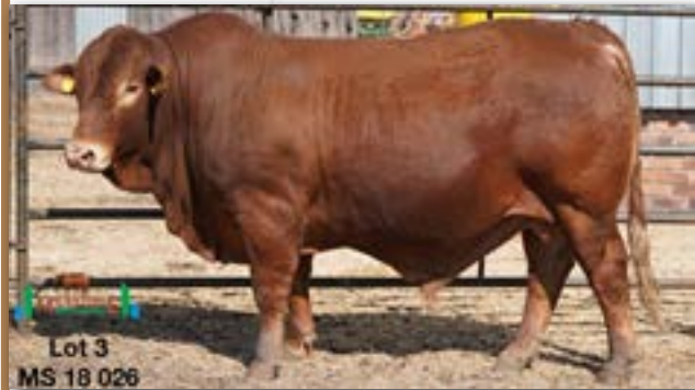
Lot 3 MS 18 026

MILESTONE MS 150154 - B 0082437062 - 21-SEP-15