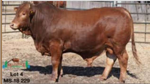
Lot 4 MS.18 229

Ident. number Sex Section Reg. number Birth Date MS 180229 MALE SP 0087591038 08-OCT-18