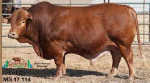
Lot 25 MS 17 114

MILESTONE MS 170114 - B 0085760163 - 29-AUG-17