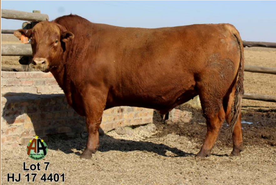
Lot 7 HJ 17 4401